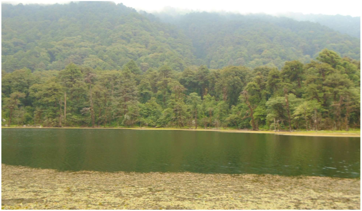
पर्यटकिय क्षेत्र रामारोशन ताल, अछाम