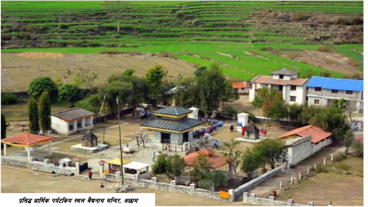
प्रसिद्ध धार्मिक पर्यटकिय स्थल वैद्यनाथ मन्दिर, अछाम